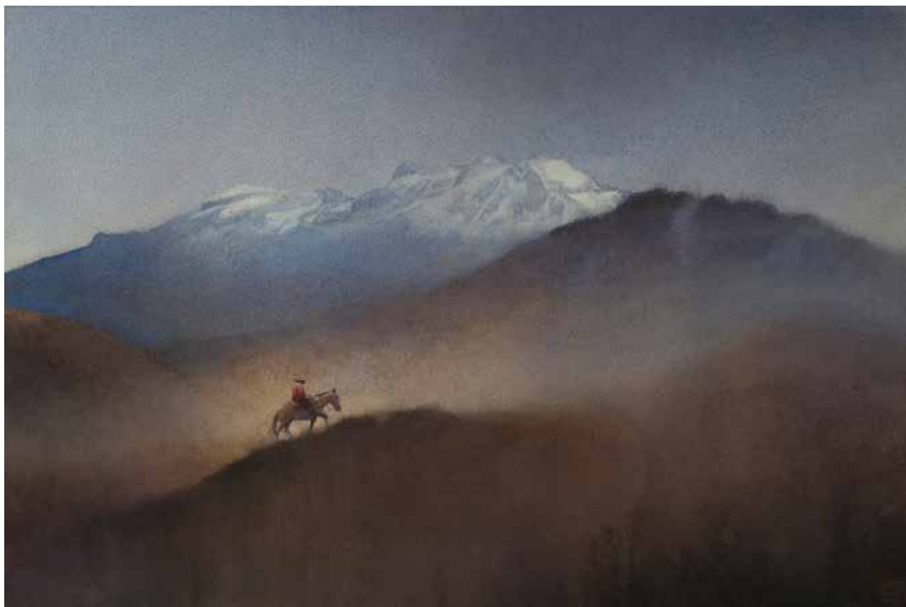
José Apaza, "Al Alba", 38 X 56 cm.

Entrevistas y reseñas en las revistas Casas + Terrenos de México, Ophelia de Argentina, Watercolor Artist de USA, L'art de l'aquarelle y Pratique des Arts de Francia, y El Búho de Perú.