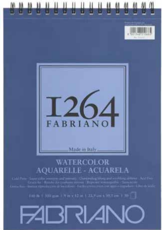
Espejo, godete estuche marca Atl, salsera, block de papel.