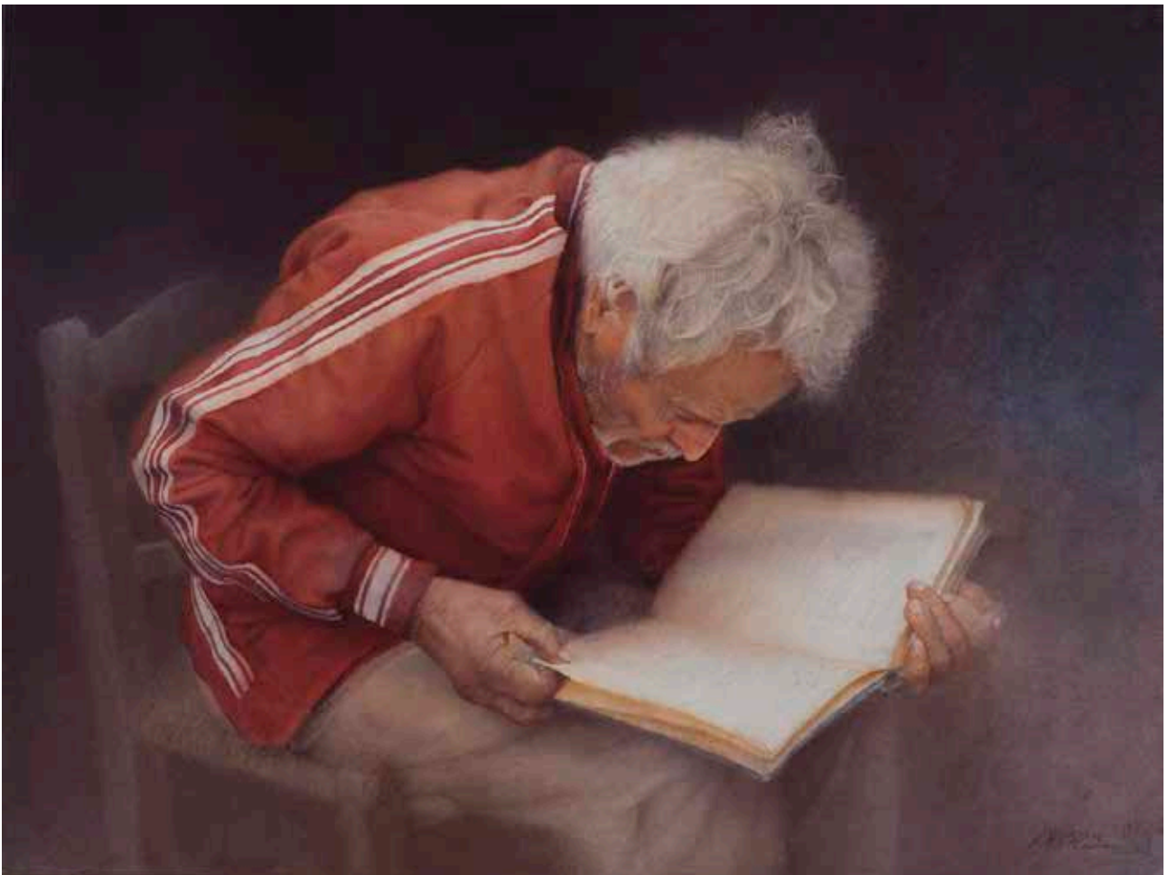
José Apaza, "El conocimiento II", 56 X 76 cm.

Entrevistas y reseñas en las revistas Casas + Terrenos de México, Ophelia de Argentina, Watercolor Artist de USA, L'art de l'aquarelle y Pratique des Arts de Francia, y El Búho de Perú.